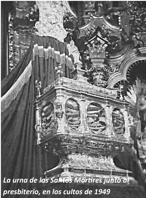
La urna de los Santos Mártires junto al presbiterio, en los cultos de 1949