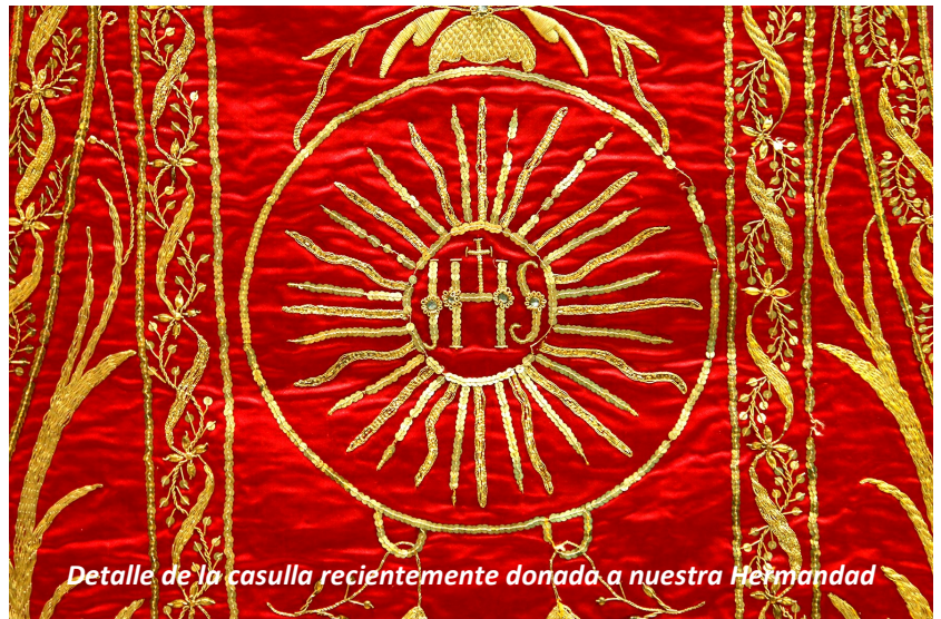
Detalle de la casulla recientemente donada a nuestra Hermandad